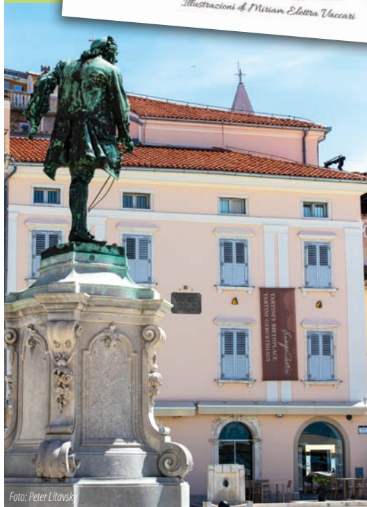
Statua di Tartini e Casa Tartini a Pirano