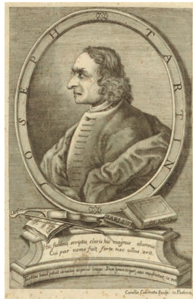
Ritratto di Giuseppe Tartini

"Sì, è stato il più grande violinista del Settecento. Ma che dico, il più grande violinista di tutti i tempi! Giuseppe Tartini è nato proprio qui a Pirano l'8 aprile del 1692. Lo vedi quel palazzo? È Casa Tartini, uno dei palazzi più antichi della piazza, e Tartini è nato in una delle sue stanze. Il monumento è stato eretto solo nel 1896, perché la piazza dove ci troviamo, prima di prendere l'aspetto attuale, era un mandracchio per le barche dei pescatori..."