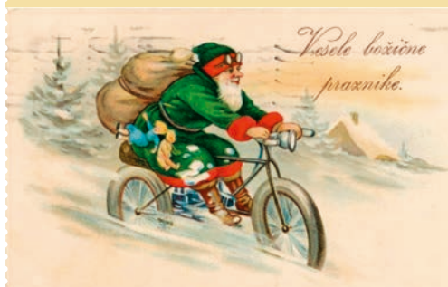
Kamra, objavila Knjižnica Mirana Jarca Novo mesto; 1. polovica 20. stol.; dela v javni domeni

Kmalu nas bodo obiskali trije dobri možje. Mi jih že nestrno pričakujemo, ampak da bi jih lahko sprejeli tako, kot si zaslužijo, jih moramo najprej dobro spoznati. V prvem delu delavnice bomo spoznavali šege v adventnem času, veliko zanimivosti o Miklavžu, Božičku in Dedku mrazu, sledila pa bo ustvarjalna delavnica. Spremljaj našo spletno stran ali profil Facebook in izvedel boš več o delavnici. * Tjaša