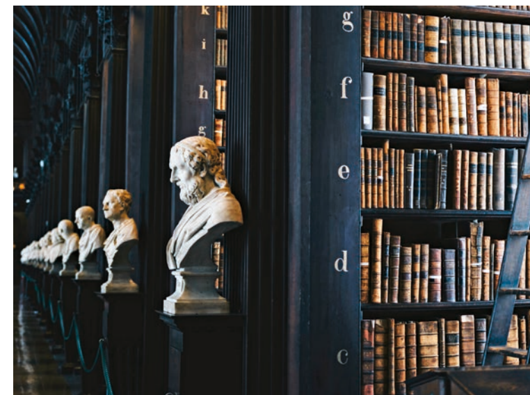
Filozofija je starodavna veda, ki že tisočletja išče odgovore na temeljna vprašanja o tem, kaj človek je in kako naj deluje v svetu.

*Dysonova sfera je velikanska hipotetična struktura, ki v celoti objame zvezdo in s tem „ujame“ oziroma izkoristi vso energijo, ki jo zvezda oddaja. Pogosto se pojavlja v znanstveno-fantastičnih filmih.